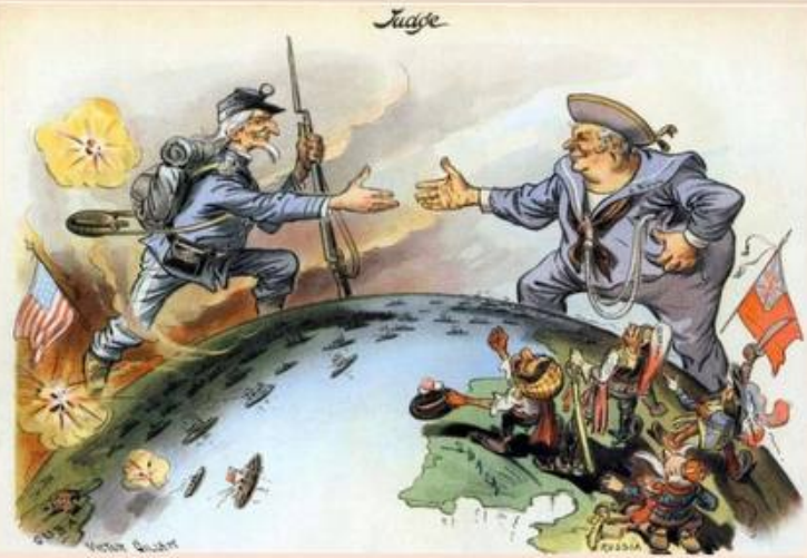
Американська карикатура кінця XIX ст.