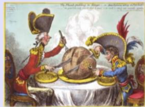
Англійська карикатура 1805 р.